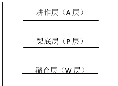
图3 水稻土剖面示意图

对A层特别深厚，沉积层不甚发育，一米内见不到母质的土类剖面，按A层5~20cm、A/B层60~90cm、B层100~200cm采集土壤。草甸土和潮土一般在A层5~20cm、C1层（或B层）50cm、C2层100~120cm处采样。