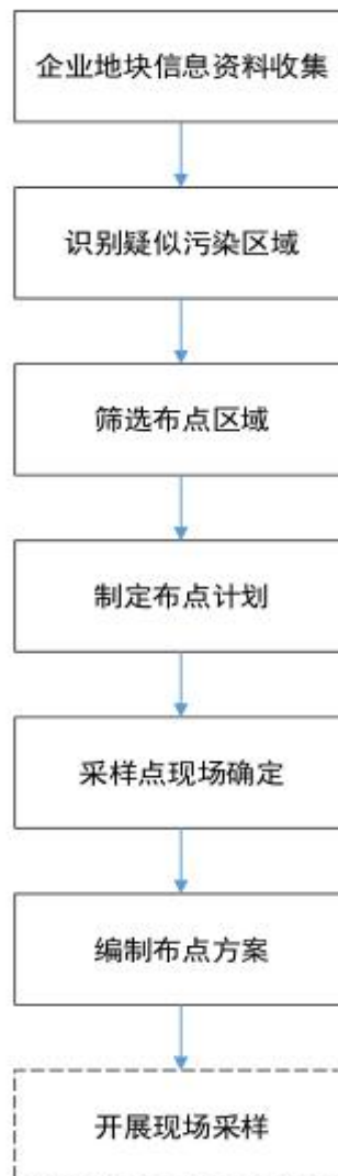
图 1 疑似污染地块布点工作程序

土壤环境自行监测工作程序包括：资料收集、现场踏勘、人员访谈、重点区域及设施识别、制定布点计划、采样点现场确定、编制布点方案，工作程序见图1。